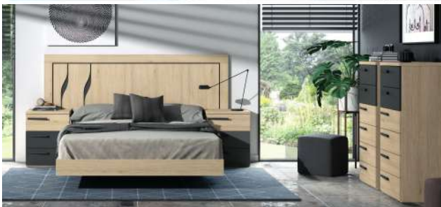
BSC 15 Flow

LAS POSIBILIDADES DE COMPOSICIONES NO TIENEN LIMITES