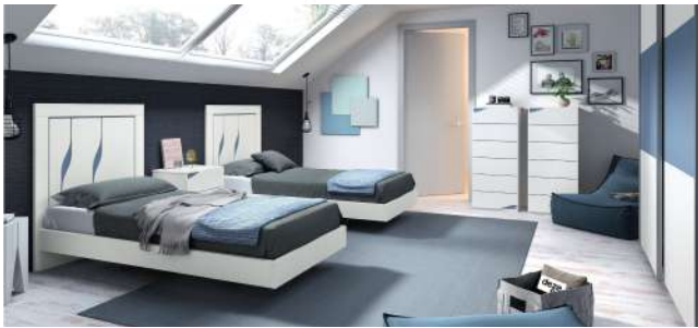
BSC 14 Flow