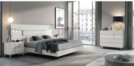
BSC 08b Shade