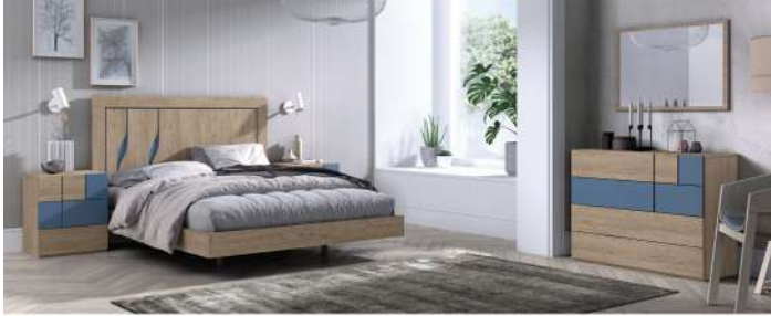
BSC 13 Flow