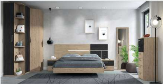
BSC 07 Craik